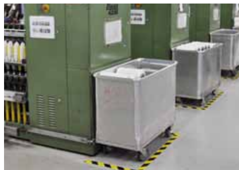
Transportwagen für Cops, Spulen und Hülsen