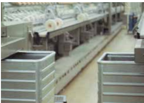
Transport und Lagerung von Cops und Spulen