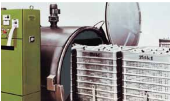
Dämpfen von Cops and Spulen