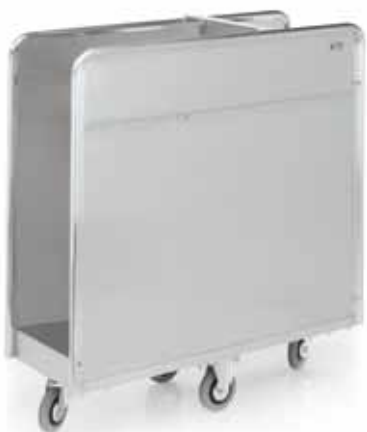
Vorgarn-Spulenwagen E 41