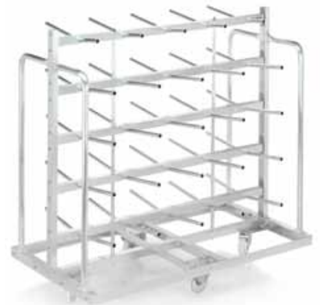
Spulen-Aufsteckwagen E 42