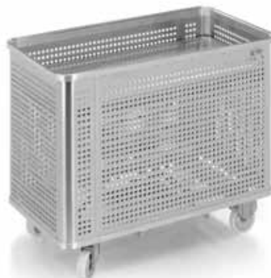
Garn-Dämpfwagen mit Federboden D 04